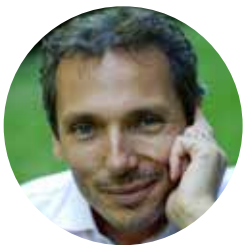
Laurent Gounelle Écrivain

Laurent Gounelle est l'auteur de « L'homme qui voulait être heureux », « Le jour où j'ai appris à vivre », ouvrages plébiscités par les lecteurs du monde entier. Il épingle avec humour les travers de la société moderne et guide ses lecteurs dans leur recherche d'équilibre et d'épanouissement personnel.