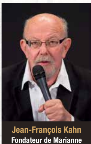
Jean-François Kahn Fondateur de Marianne

La croisière des Idées organisée par Marianne en novembre dernier a été, de l'avis général, un franc succès et nombreux sont ceux qui ont souhaité la réédition de cette fabuleuse expérience. C'est pourquoi, cette année, TMR a sélectionné pour vous ce nouveau projet. À l'occasion d'un parcours unique qui permettra de croiser et de découvrir tous les grands lieux de la civilisation - Rome, Athènes, Crète, Jérusalem -, penseurs, chercheurs, historiens, spécialistes, écrivains et journalistes de toutes sensibilités ont accepté de nous rejoindre pour participer aux échanges et débats.